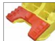
RP40-IT RP50-IT RP80-IT

Das Speed-Valve senkt die Öffnungs- und Schließzeiten, wodurch die Leistungsfähigkeit gesteigert wird.