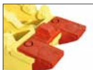
RP10-IT RP16-IT RP20-IT RP30-IT

Dank der austauschbaren Verschleißteile , wie Platten und Messer zum Schneiden von Rundeisen, können die Wartungstätigkeiten einfach und schnell durchgeführt werden.